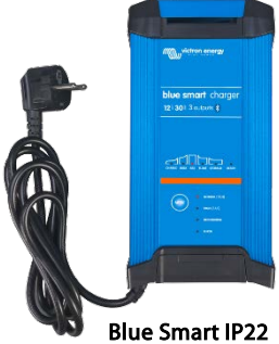
Blue Smart IP22 12/30 (3)